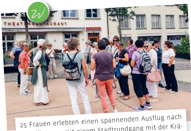
25 Frauen erlebten einen spannenden Ausflug nach Schaffhausen mit einem Stadtrundgang mit der Krämerin, Durch-die-Altstadt-Flanieren und geselligem Beisammensein.