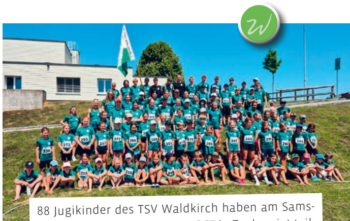
88 Jugikinder des TSV Waldkirch haben am Samstag, 20. Juni 2026, am Jugitag OST in Zuckenriet teilgenommen. Bei hochsommerlichen Temperaturen haben die Kinder vollen Einsatz gegeben und super Leistungen erzielt. Der TSV Waldkirch ist stolz auf die guten Resultate und gratuliert allen Jugikindern!