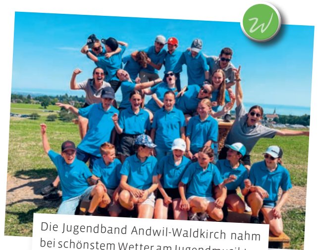
Die Jugendband Andwil-Waldkirch nahm bei schönstem Wetter am Jugendmusiktag des Blasmusik-Open-Airs in Mörschwil teil.