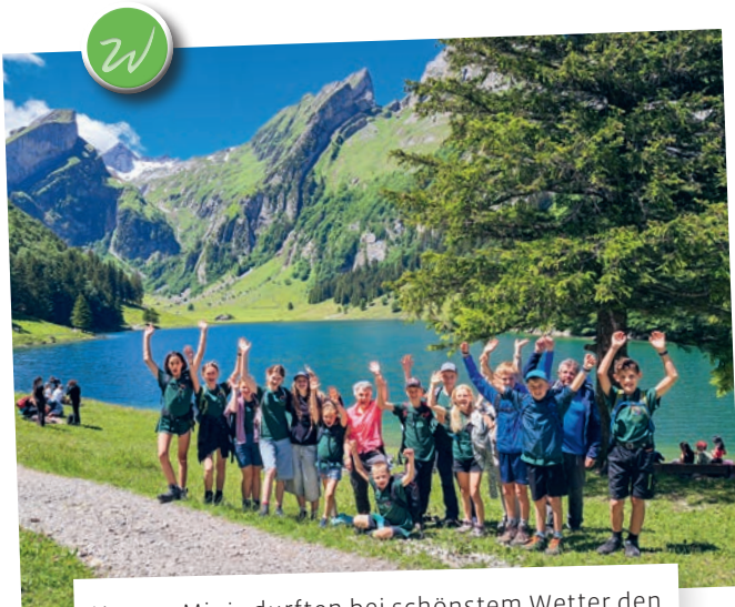
Unsere Minis durften bei schönstem Wetter den Ausflug zum Seealpsee geniessen.