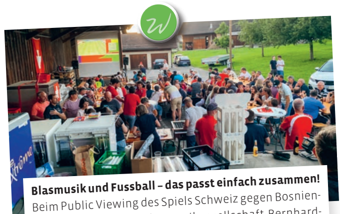
Blasmusik und Fussball – das passt einfach zusammen! Beim Public Viewing des Spiels Schweiz gegen Bosnien-Herzegowina sorgte die Musikgesellschaft Bernhardzell mit einem Platzkonzert vor dem Anpfiff für beste Unterhaltung. Vielen Dank an alle Besucherinnen und Besucher. Es war ein toller Abend mit einer grossartigen Atmosphäre!