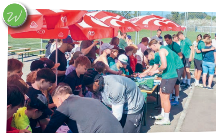
Grosse Begeisterung beim Abschlusstraining des FCSG auf der Sportanlage Waldkirch vor dem Auswärtsspiel in Bern

Am Donnerstag, 7. Mai 2026, findet von 17.00 bis 18.30 Uhr die Rechtsberatung des Amtsnotariates St.Gallen in den Räumlichkeiten des Amtes für Handelsregister und Notariate, Davidstrasse 27, 9000 St.Gallen, statt (ohne Voranmeldung). Dabei werden vor allem Fragen aus dem ehelichen Güterrecht und dem Erbrecht, aber auch Fragen zu Beurkundungen beantwortet.