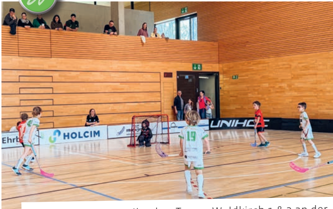
F-Junioren WASA Unihockey Teams Waldkirch 1 & 2 an der Bärenliga vom 28. März in Mörschwil.