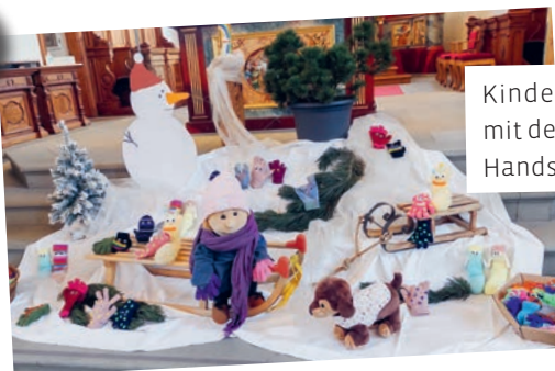
Kindergartengottesdienst mit der Geschichte «3 kleine Handschuhe»