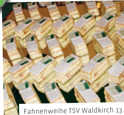
Fahnenweihe TSV Waldkirch 13. Dezember 2025