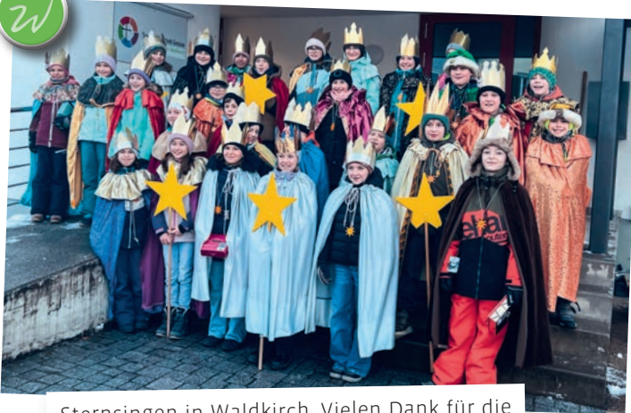
Sternsingen in Waldkirch. Vielen Dank für die vielen Spenden und den freundlichen Empfang!