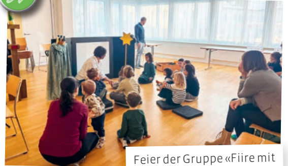
Feier der Gruppe «Fiire mit de Chline» zum Thema «Die heiligen drei Könige»