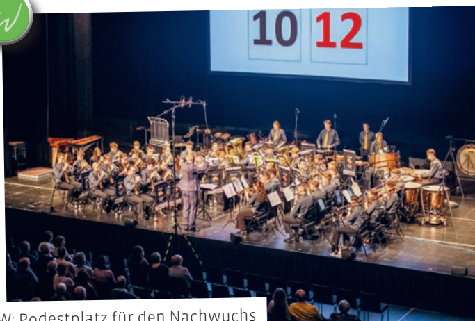
Liberty Brass Band am SBBW: Podestplatz für den Nachwuchs