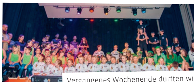
Vergangenes Wochenende durften wir erfolgreich unsere Turnshow unter dem Motto LOST IN SPACE präsentieren. Herzlichen Dank für euren Besuch. STV Bernhardzell