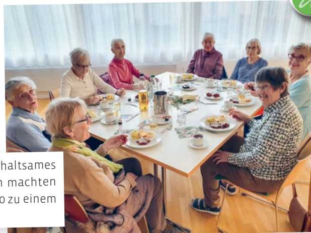
Eine besinnliche Geschichte, ein Stern-Puzzle, ein unterhaltsames Lotto und ein Dessert-Teller mit feinen Köstlichkeiten machten den Adventsnachmittag der Frauengemeinschaft für ü80 zu einem gemütlichen und geselligen Anlass.