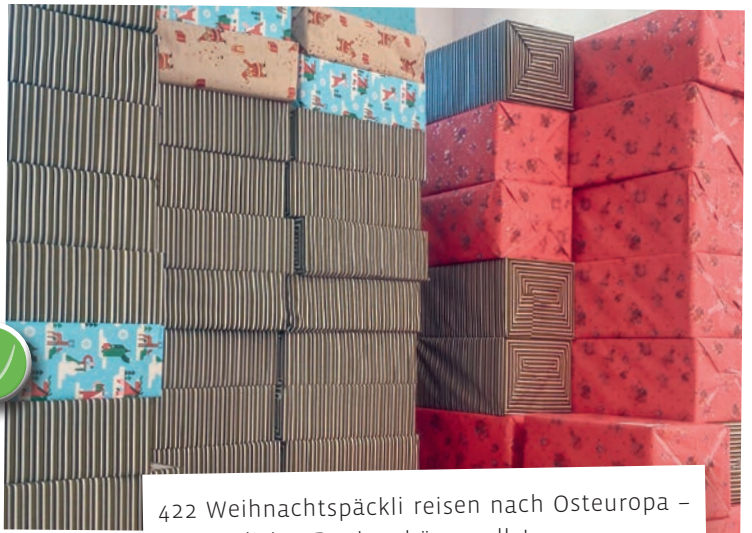
422 Weihnachtspäckli reisen nach Osteuropa – ein herzliches Dankeschön an alle!