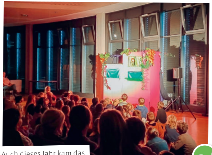
Auch dieses Jahr kam das Kasperli-Theater nach Waldkirch. Viele Kinder hörten geduldig die zwei spannenden Geschichten. Ein herzliches Dankeschön geht an alle helfenden Hände, welche einen solchen Anlass möglich machen.