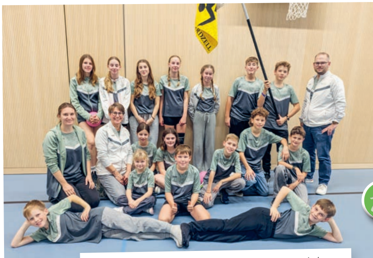
Jugi STV Bernhardzell am Toggenburg-Spieltag. Mit super Resultat: 2x 3. Rang und 1x 9. Rang.