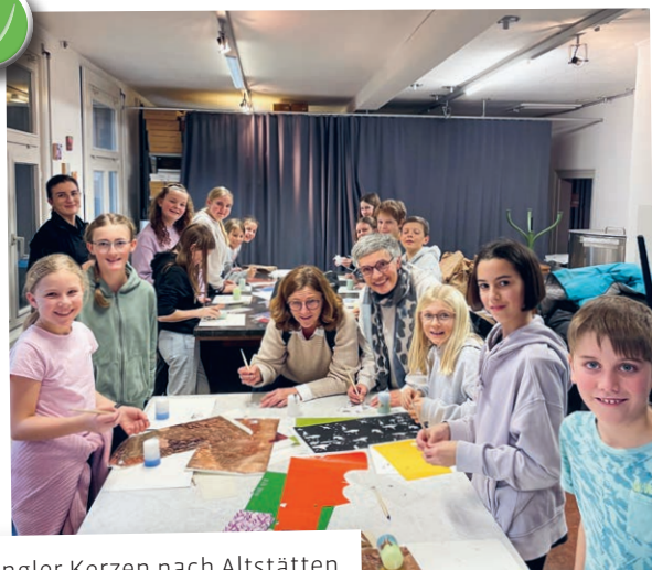
Ausflug der Ministranten zu Hongler Kerzen nach Altstätten.