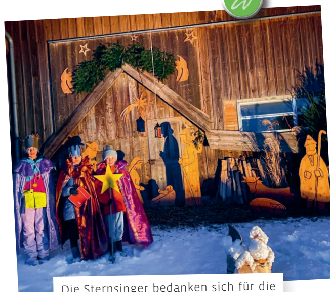
Die Sternsinger bedanken sich für die grosszügigen Spenden der Waldkircher Bevölkerung!