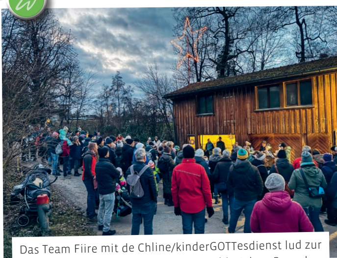
Das Team Fiire mit de Chline/kinderGOTTesdienst lud zur Stallweihnacht in Egelsee ein. Die zahlreichen Besucher durften beim gemutlichen Beisammensein Wienerli und Punsch geniessen. Vielen Dank der kath. Kirche Waldkirch.