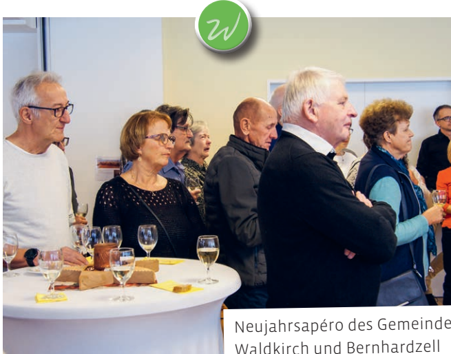
Neujahrsapéro des Gemeinderates Waldkirch und der Pfarreien Waldkirch und Bernhardzell