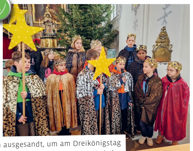
35 Sternsingerkinder wurden ausgesandt, um am Dreikönigstag in Bernhardzell den Neujahrsgross und den Segen Gottes in jedes Haus zu bringen.