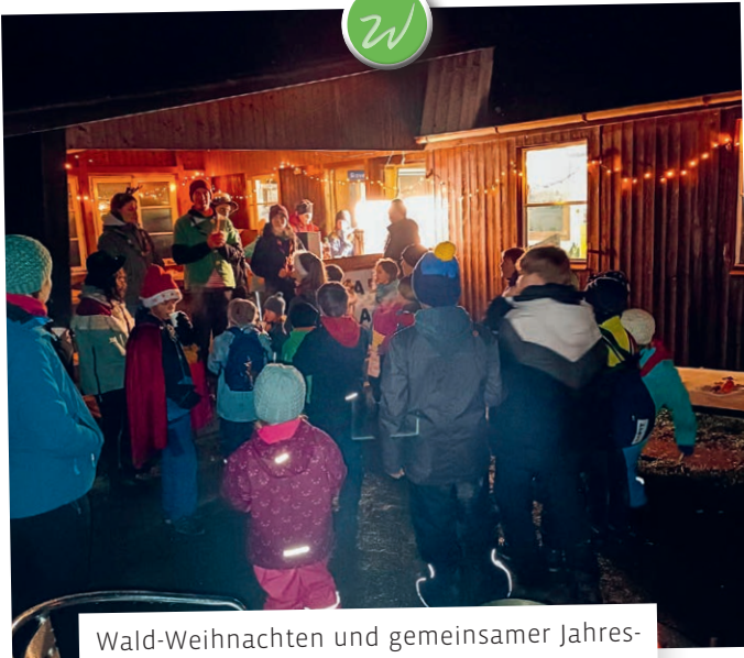
Wald-Weihnachten und gemeinsamer Jahresausklang bei der Pfadi Waldkirch.