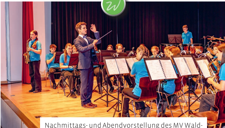
Nachmittags- und Abendvorstellung des MV Waldkirch unter dem Motto Märlizauber. Vielen Dank für den Besuch bei uns.