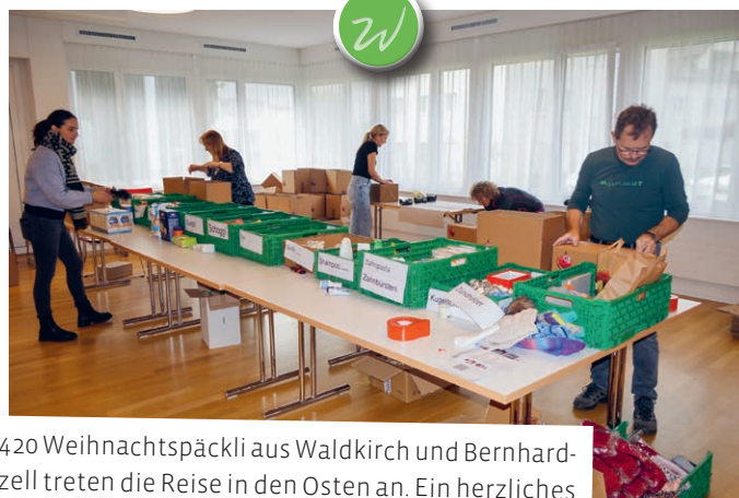
420 Weihnachtspäckli aus Waldkirch und Bernhardzell treten die Reise in den Osten an. Ein herzliches Dankeschön an alle, die dazu beigetragen haben!