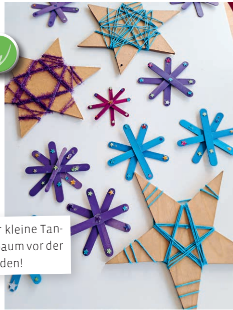
Im Fiire mit de Chline wurde nach der Geschichte «Der kleine Tannenbaum» Baumschmuck für den grossen Weihnachtsbaum vor der Kirche gebastelt. Ein Dankeschön allen helfenden Händen!