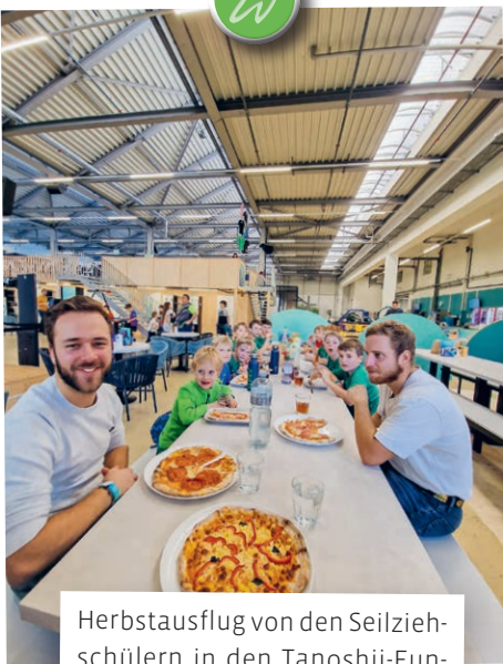
Herbstausflug von den Seilziehschülern in den Tanoshii-Funpark. Danach noch eine feine Pizza. Cool wars!