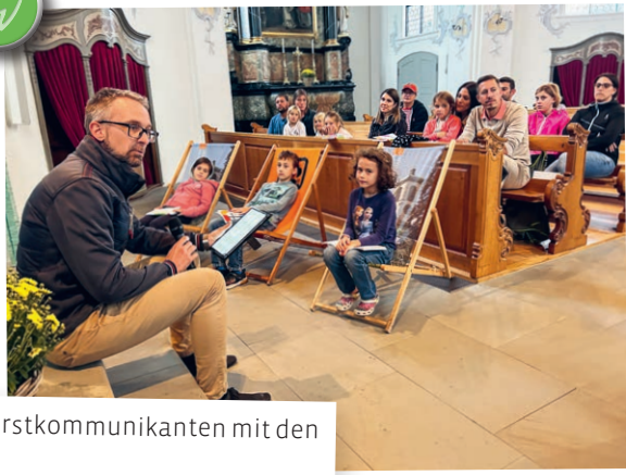
Startanlass der sechs Erstkommunikanten mit den Eltern in Bernhardzell.