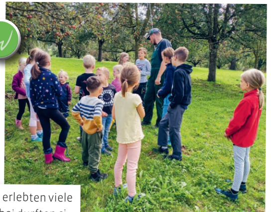
Den Weg vom Apfel zum Most erlebten viele Kinder des Familientreffs. Dabei durften sie selbst Hand anlegen und anschliessend den frisch gepressten Most geniessen.