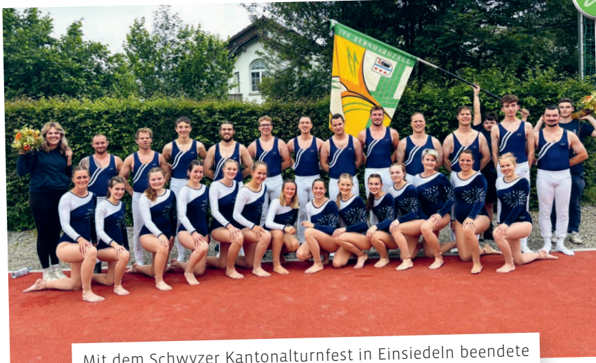
Mit dem Schwyzer Kantonaltturnfest in Einsiedeln beendete der STV Bernhardzell die Turnfestsaison.