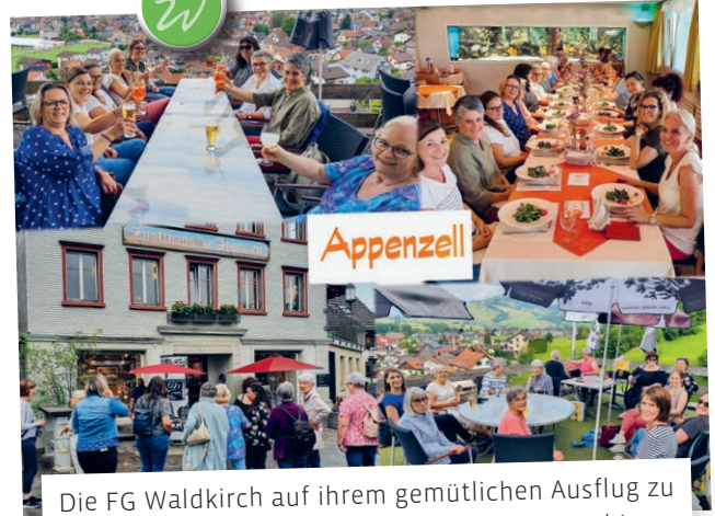
Die FG Waldkirch auf ihrem gemütlichen Ausflug zu Besuch beim Zunfthaus und Appenzeller Alpenbitter.