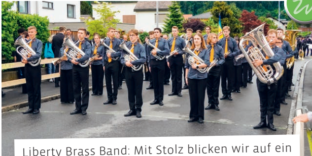
Liberty Brass Band: Mit Stolz blicken wir auf ein erfolgreiches St.Galler Kantonalmusikfest zurück.