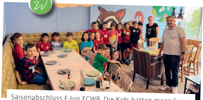
Saisonabschluss E-Jun FCWB. Die Kids hatten mega Spass im Trampolinpark und beim anschliessenden Pizzaplusch.