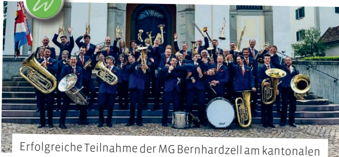
Erfolgreiche Teilnahme der MG Bernhardzell am kantonalen Musikfest in Mels mit einem zweiten Platz in der Parade-musik und einem fünften Platz im Wettspiel.