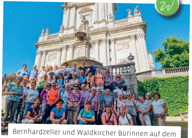
Bernhardzeller und Waldkircher Bürinnen auf dem gemeinsamen Ausflug in Solothurn.