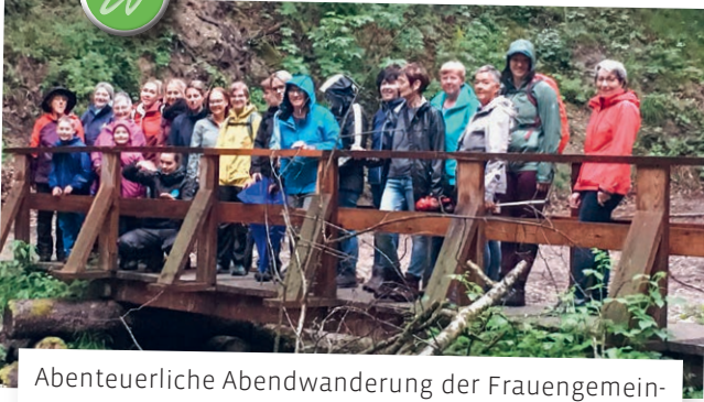
Abenteuerliche Abendwanderung der Frauengemeinschaft Bernhardzell durch die Weissbachschlucht.