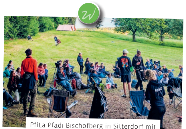
PfiLa Pfadi Bischofberg in Sitterdorf mit 28 Pfadern und 23 Wölflis.