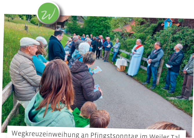
Wegkreuzeinweihung an Pfingstsonntag im Weiler Tal.