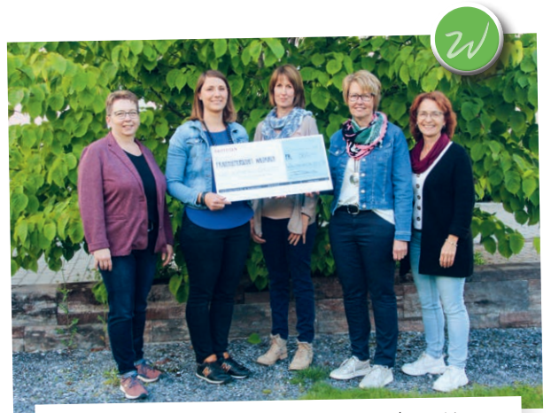
Aus dem Erlös des Schätzspiels an der HV 2024 durfte die Frauengemeinschaft 900 Franken an den «Entlastungsdienst Ostschweiz» spenden.