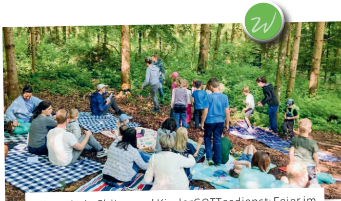
Fiire mit de Chline und KinderGOTTesdienst: Feier im Wald bei der Hofjüngerhütte.